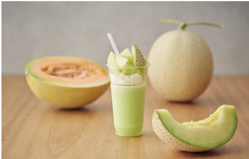
『一果のパフェ メロン』

株式会社青木商店(本社：福島県郡山市、代表取締役社長：青木大輔)が運営する、フルーツジュースやスイーツの販売を行う東京・自由が丘の新業態「一果房」は、“メロン”にスポットを当てたパフェやジュース、ゼリーなどを2024年3月29日(金)から2024年4月25日(木)までの期間限定で販売いたします。メロンのおいしさを存分に味わえる一果房の人気商品『一果のパフェ』や、品種による異なる味わいを楽しめる飲み比べ『フライト』など、幅広い商品ラインアップをご用意いたします。