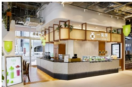
一果房 店装イメージ

「一果房」は、株式会社青木商店の100周年を記念し、2023年10月JIYUGAOKA de aone内にオープンした新業態です。その時その瞬間のフルーツと出会う「一果一会」をテーマに、フルーツの専門家が季節ごとに最もお勧めしたい「ひとつのフルーツ」にスポットを当てたフルーツジュースやスイーツを提供するお店です。フルーツの様々な品種や様々な食べ方を通して、フルーツの新たな魅力をお届けいたします。