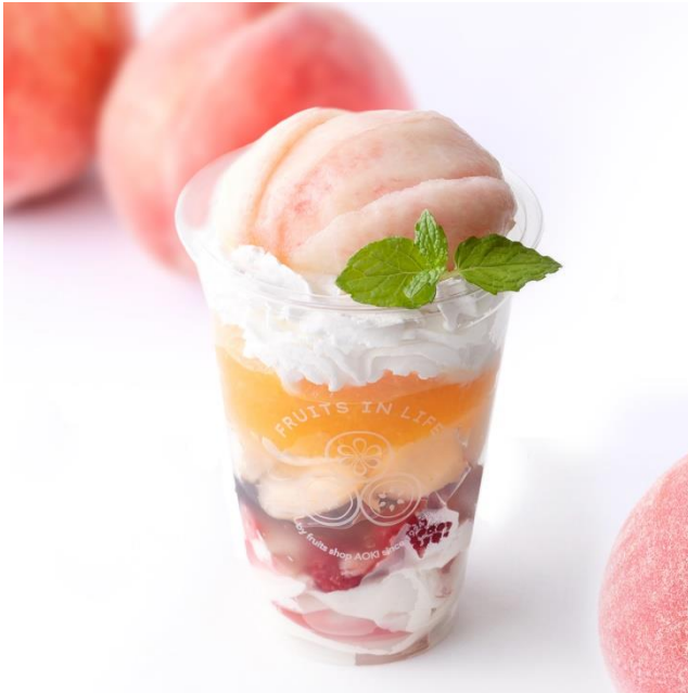
『たっぷり桃のフルーツパフェ』

『ピーチ&ストロベリー』は、桃といちごの爽やかな組み合わせを楽しめるデトックススムージーです。口いっぱいに広がる桃の甘さに、すっきりとした酸味のいちごがベストマッチ！フルーツの中でもビタミンCが豊富ないちごを使った、体にうれしい一杯です。