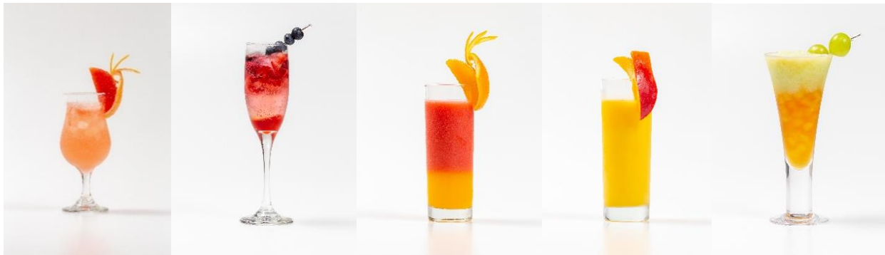
(左からソルティグレフル、スパークリングベリー、ブリリアント、トロピコ、シャインティ(季節のモクテル)) << 『フルーツモクテル』 5 種 >>

創業 98 年のフルーツ専門店「フルーツショップ青木」を運営する青木フルーツホールディングス株式会社(本社：福島県郡山市、代表取締役会長兼社長：青木信博)は、フルーツタルトの販売・カフェ運営を行うフルーツピークス(fruitspeaks)のカフェ併設店(9店舗)にて、2022年9月1日(木)より、フルーツピークス初となる『フルーツモクテル』(5種)を販売いたします。