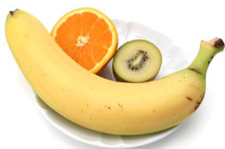
◀ 1日200gのフルーツ例 ▶

アオキフルーツオンライン( https://aokifruitsonline.com/ )は、創業98年のフルーツ専門店「フルーツショップ青木」が運営するオンラインショッピングサイトです。熟練のフルーツマイスターが産地や気候、栽培状況や果物の仕上がりを見極め厳選した、極上のフルーツを詰め合わせたギフトを中心に販売を行っています。