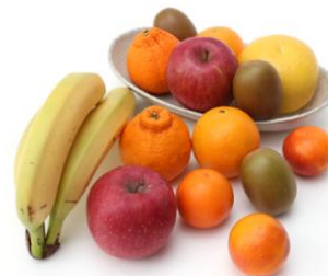
◀ 『おうち de フルフル 200』お届けイメージ ▶