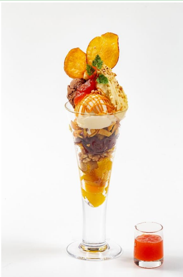
『シルクスイートの焼き芋パフェ』

フルーツピークスでは、シーズンごとに季節を楽しめる彩り豊かなパフェをご提供しています。